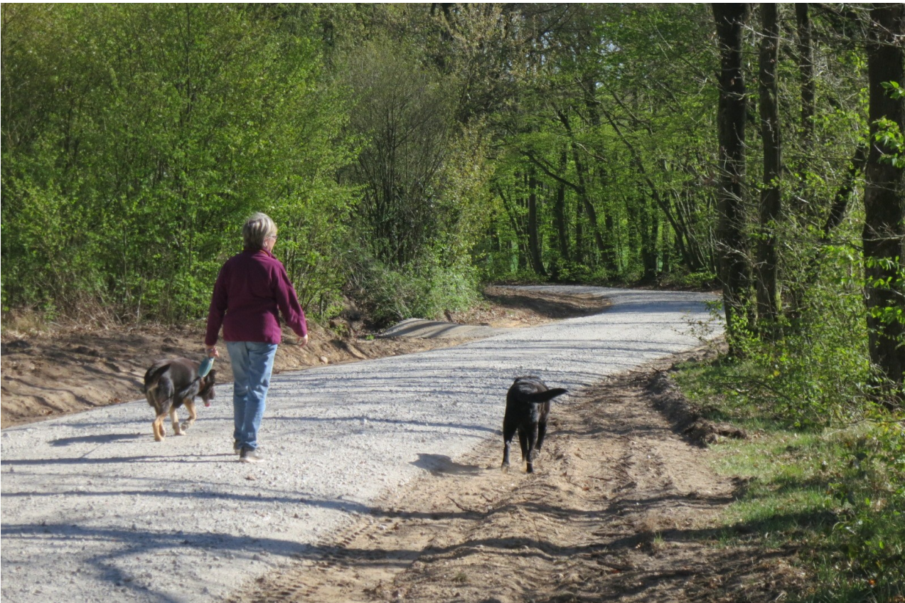
Silvia Boysen mit ihren Hunden unterwegs auf dem neuen Belag.

Im April hat der unbefestigte Teil der „Alten Landstraße“ eine neue Deckschicht bekommen. Das Niveau der Fahrbahn ist deutlich erhöht worden, wodurch bei starkem Regen das Wasser seitlich ablaufen kann. Bisher hat sich der Weg bei Starkregen immer in ein Bachbett verwandelt. Entsprechend sah er hinterher immer aus. Das wird jetzt nicht mehr passieren. Bleibt nur zu hoffen, dass nicht bald wieder Schlaglöcher in den Belag gefahren werden. Darum: langsam fahren. Schneller geht es besser auf der Kreisstraße nebenan.