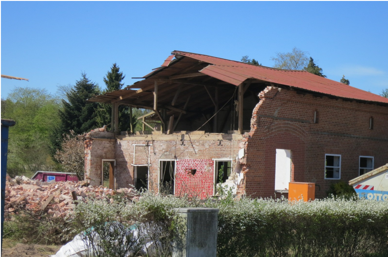
Das Wohnhaus ist schon weg. Stand am 24. April