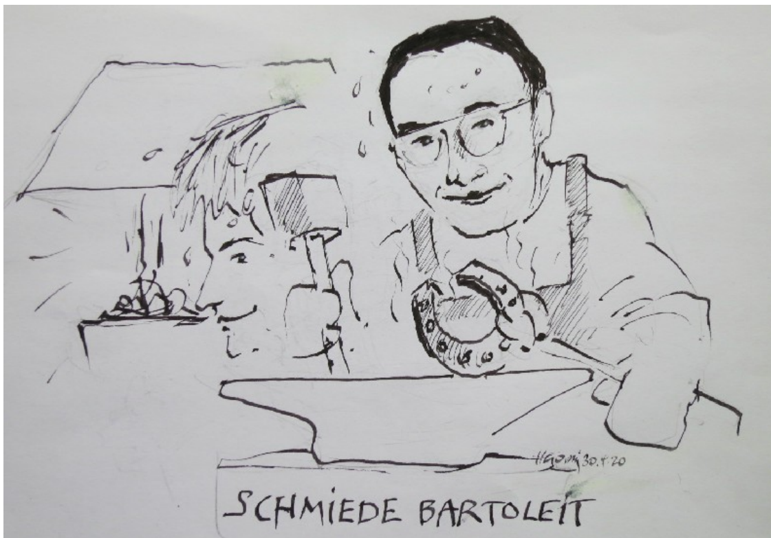
Zeichnung: Horst Görnig

Einen Ring zu schmieden sah auf den ersten Blick einfach aus. Die beiden Enden mussten aber feuerverschweißt werden, wie wir das nannten. Das ging so: Erst wurden die beiden Enden schräg abgeflacht, so dass sie beim fertig gebogenen Ring übereinander lagen. Dann wurde die Schweißstelle im Feuer bis zur Weißglut erhitzt. Das erforderte absolute Aufmerksamkeit, denn nach Weißglut kommt verbrannt, und damit ist das Werkstück nicht mehr brauchbar. Damit dies nicht geschah, wurde mit einem flachen Löffel etwas Sand auf die weiß glühende Schweißstelle appliziert. Der Sand schmolz, legte sich um das Eisen und schloss es so gegen die Luft ab. Damit wurde das Verbrennen unterbunden. Noch ein kleines Weilchen, dann nahm man das Eisen aus dem Feuer, schwenkte es einmal kräftig nach unten um den flüssigen Sand abzuschütteln, legte die Schweißstelle auf den Amboß und fügte die beiden Enden mit gefühlvollen Hammerschlägen zusammen. Das Eisen war bei dieser Hitze weich wie Kuchenteig. So konnten die beiden Enden mit den leichten Hammerschlägen verbackt werden. Je besser die Schweißstelle gearbeitet war, um so schwerer war sie auf den ersten Blick zu erkennen. Um zu sehen, dass die notwendige Hitze erreicht war, dafür musste der werdende Schmied ein Gefühl entwickeln, und zwar selbst. „Das Gefühl kann dir keiner beibringen“, sagte mein Vater dazu.