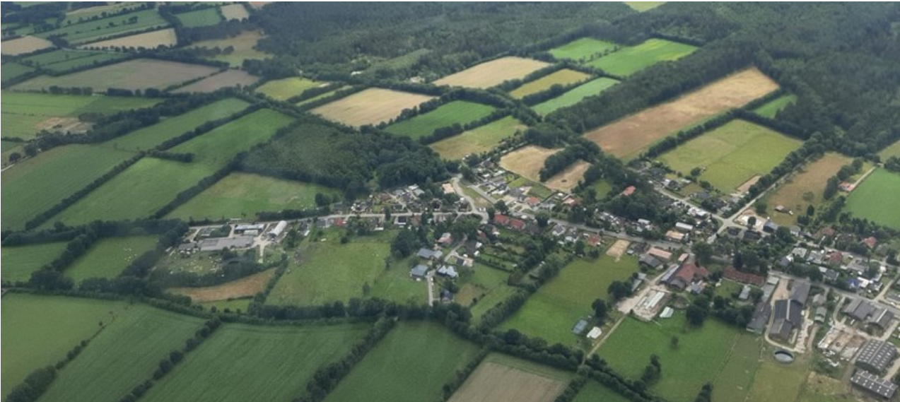
Latendorf, aus östlicher Richtung aufgenommen.