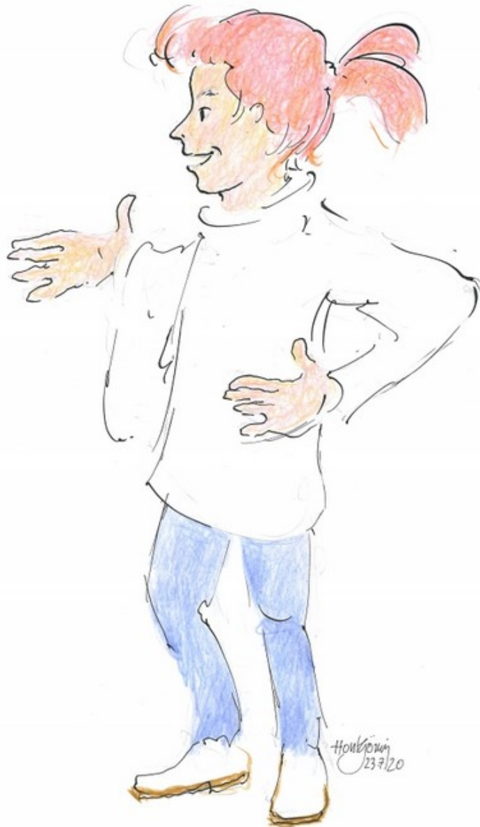
Zeichnung: Horst Görnig

Emma wird die Leserinnen und Leser der „Latendorfer Zeitung“ mit ihren Fragen unterhalten, die sie ihren Eltern oder anderen Erwachsenen stellt. Ihr Debüt auf der nächsten Seite.