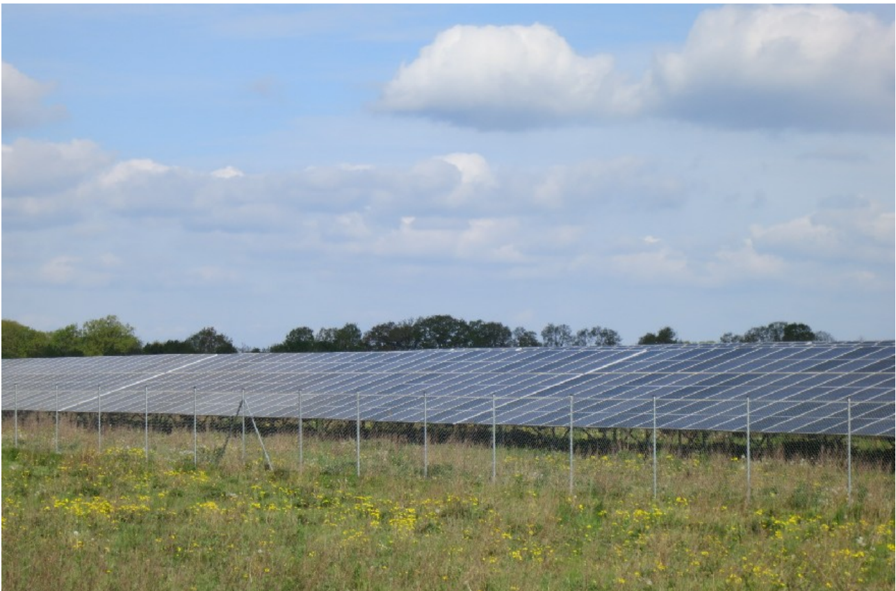
Photovoltaikanlage an der Bahnlinie Rickling – Neumünster